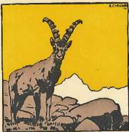
Frontispizi da l'istanza chantunala dal 1919.

gia cleras finamiras. A la fin da ses artitgel dumonda el: «Tgi prenda l'iniziativa?» Quels da Schons, pertutgads il pli ferm dals problems descrits da Conrad, l'han finalmain prenda, ed han envidà ils 27 da fanadur 1919 a la seduta surmenziunada a Tusaun. Giachen Conrad ha suttemess als delegads in program da lavor bain elavurà ed ha postulà danavmain la fundaziun d'ina organisaziun che reuniss tut las forzas rumantschas, d'ina «Lia Rumantscha». La radunanza ha decis en ina resoluziun da realisar il postulat da Conrad. Ils 26 d'october 1919 èn sa scuntrads 24 delegads en l'hotel «Capricorn» a Cuira ed han fundà la Lia Rumantscha.